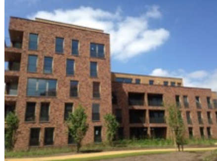
Appartementsgebouw Jansiusshofsite te Leuven

Volume: 8.622 m 3 - Verliesoppervlakte: 3.208 m 2