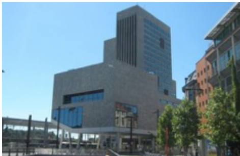
VAC te Gent

Volume: 151.729 m 3 - Verliesoppervlakte: 25.153 m 2