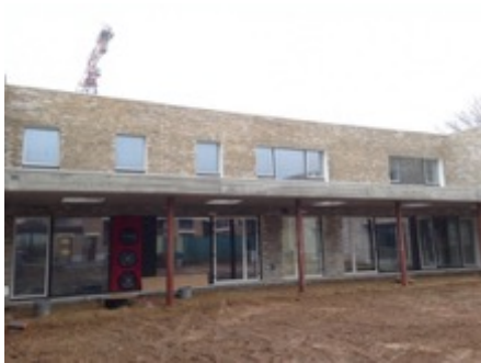
Scholen van Morgen te Kuringen

Volume: 22.690 m 3 - Verliesoppervlakte: - m 2