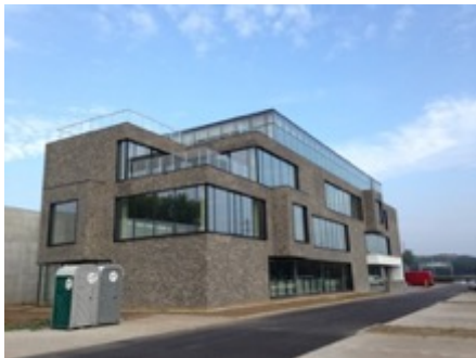
Kantoorgebouw te Mechelen

Volume: 16.520 m 3 - Verliesoppervlakte: 5.176 m 2