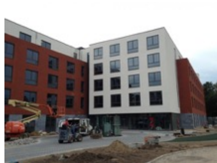
Woon-en zorgcentrum te Evere

Volume: 23.899 m 3 - Verliesoppervlakte: 7.897 m 2