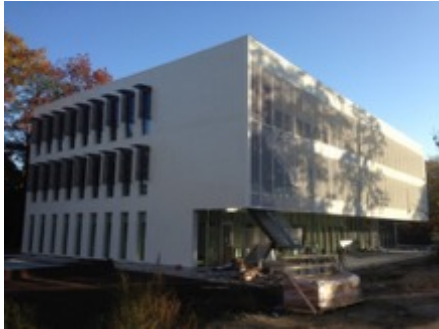
Medisch centrum Genk

Volume: 10.014,34 m 3 - Verliesoppervlakte: 3.404,30 m 2