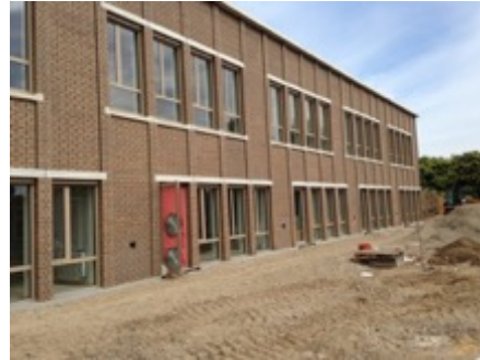
Scholen van Morgen te Kuringen

Volume: 7.434 m 3 - Verliesoppervlakte: 2.964 m 2