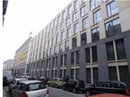
Kantorenproject Forum II te BRussel

Volume: 55.865 m 3 - Verliesoppervlakte: 12.954 m 2