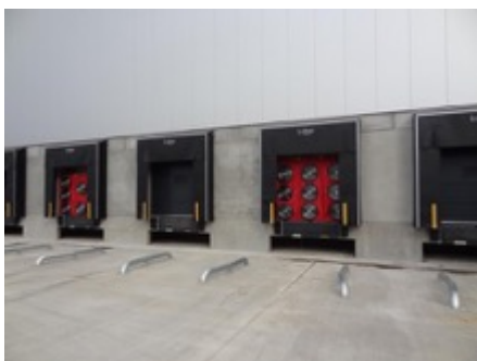
Industriehal te Willebroek

v 50 : 5,61 m 3 /h.m 2 - n 50 : 0,93 h -1