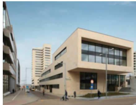
VAC te Leuven

Volume: 74.760 m 3 - Verliesoppervlakte: 24.030 m 2