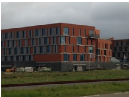
Katoennatie te Kallo

Volume: 25.456 m 3 - Verliesoppervlakte: 7.364 m 2