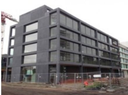
Nieuw Zuid Blok 1

Volume: 8.526,86 m 3 - Verliesoppervlakte: 2.099,95 m 2