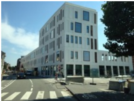
Schoolgebouw Hardenvoort te Antwerpen

Volume: 40.023,39 m 3 - Verliesoppervlakte: 27.759 m 2