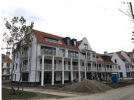
Appartementsgebouw Duinenwater te Knokke

Volume: 4.590,18 m 3 - Verliesoppervlakte: 1.944,93 m 2