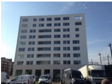
Appartementsgebouw Kievit II te Antwerpen

Volume: 14.789,65 m 3 - Verliesoppervlakte: 4.200,18 m 2