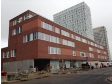
Artesis hogeschool te Antwerpen

Volume: 63.078 m 3 - Verliesoppervlakte: 19.032 m 2