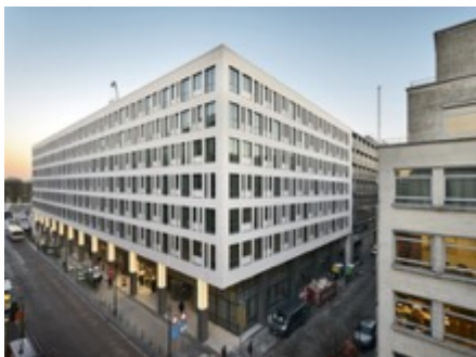
Kantoorgebouw Art Lux te Brussel

Volume: 57.482 m 3 - Verliesoppervlakte: 12.774 m 2