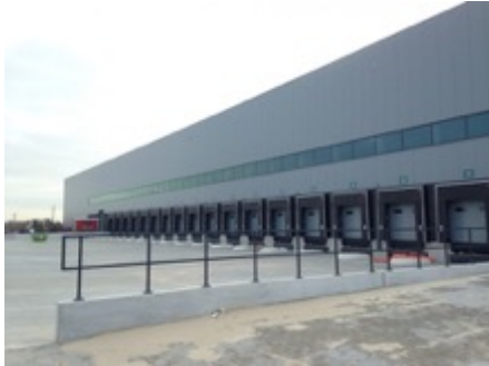
Distributiecentrum te Venlo(NL)

Volume: 440.000 m 3 - Verliesoppervlakte: - m 2