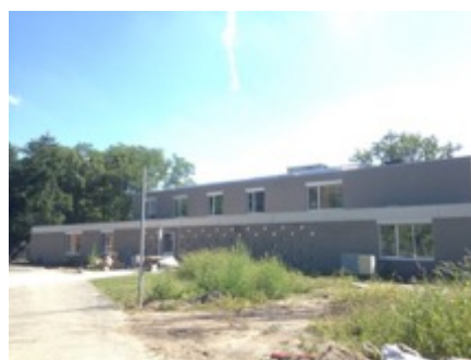
Doorstroomhuis voor gehandicapten te Zoersel

Volume: 3.918,76 m 3 - Verliesoppervlakte: 2.667,34 m 2