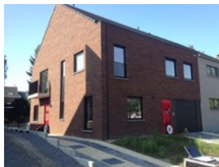
Meergezinswoning te Machelen

Volume: 1.067,56 m 3 - Verliesoppervlakte: 573,75 m 2