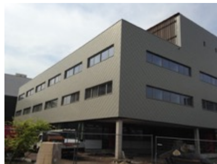
Universiteit te Gent

Volume: 24.065 m 3 - Verliesoppervlakte: 5.883 m 2