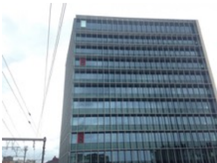
Kantoorgebouw Kievit II te Antwerpen

Volume: 38.954 m 3 - Verliesoppervlakte: 7.423 m 2