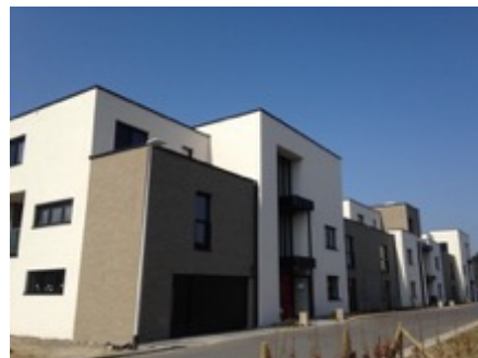
Gelijktijdige meting van 3 app. blokken

Volume: 8.477,30 m 3 - Verliesoppervlakte: 4.491,70 m 2