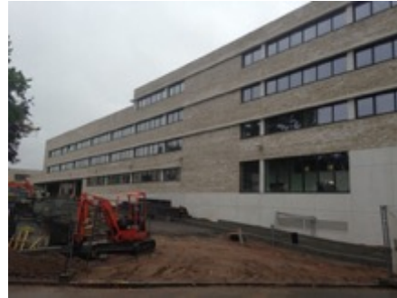
School Kasterlinden te St. Agatha Berchem

Volume: 38.954 m 3 - Verliesoppervlakte: 7.423 m 2