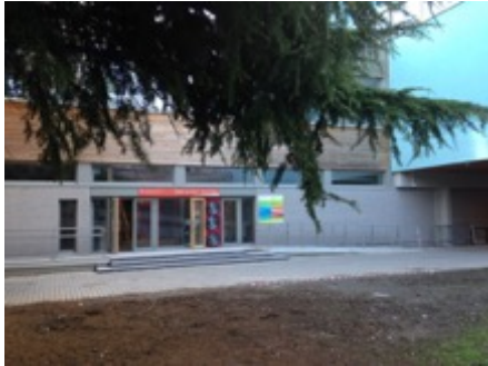
Zwembaden van Laken

Volume: 41.075 m 3 - Verliesoppervlakte: 15.418,68 m 2