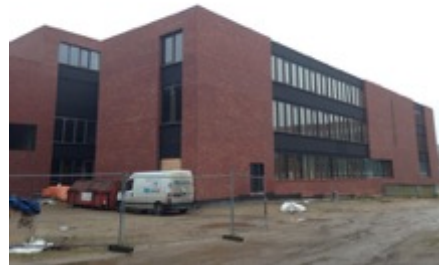
ZOL zusterschool te Genk

Volume: 43.437,40 m 3 - Verliesoppervlakte: 11.518 m 2