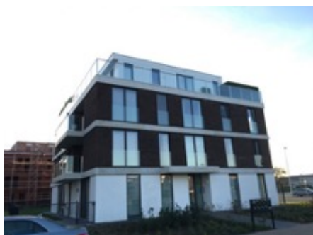
Appartementsgebouw te Meise

Volume: 2.953 m 3 - Verliesoppervlakte: 1.280 m 2