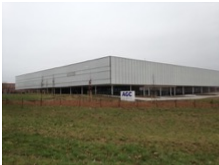
AGC kantoorgebouw te Louvain La Neuve

Volume: 50.550 m 3 - Verliesoppervlakte: 18.020 m 2